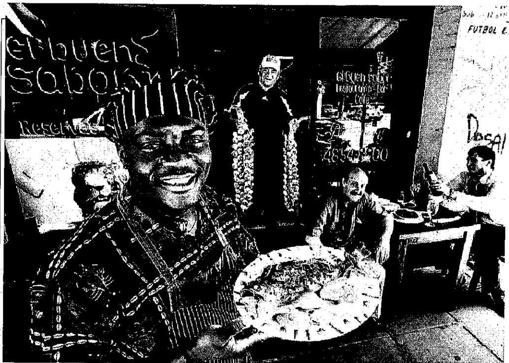
Como en Camerún. Todo el color y los sabores de los platos típicos de Camerún están en El Buen Sabor.

A los clásicos italianos y españoles se les sumaron los asiáticos y africanos.