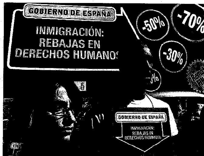
Documento 4 : marcha de protesta en Madrid