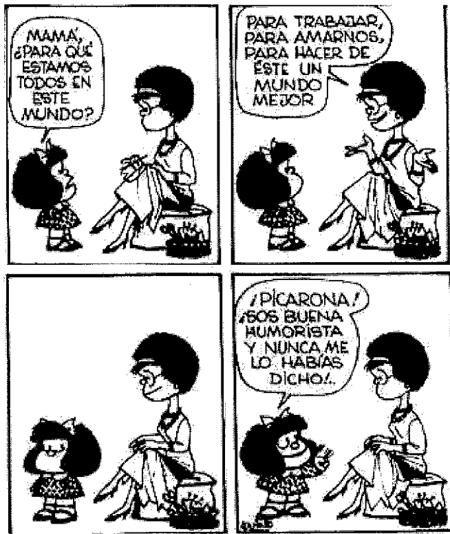
Documento 5 : dibujo de Quino