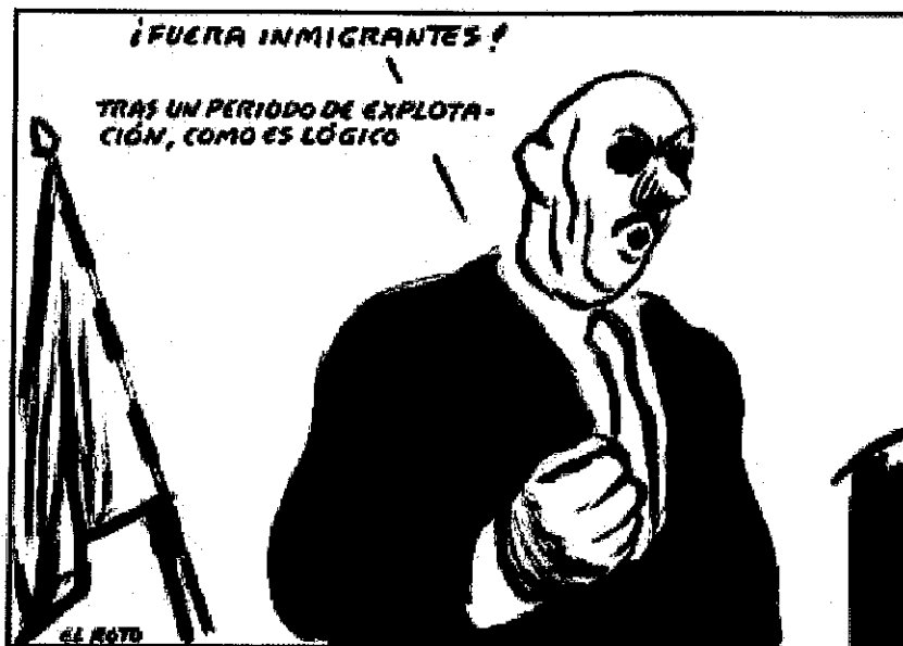
Documento 3 : caricatura de El Roto publicada en El País