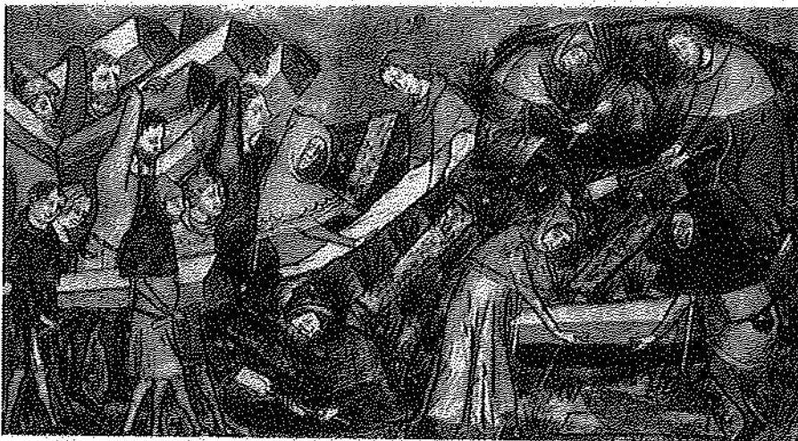
La peste de Tournai. Bruxelles, Bibliothèque royale Albert 1 er , Gil Li Musis, Chronique de Flandres de 1298 à 1352 , p. 36, XIV e siècle.