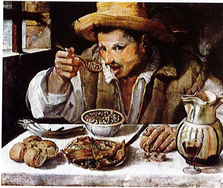
Annibale Carracci, Il mangiafagioli (1594)